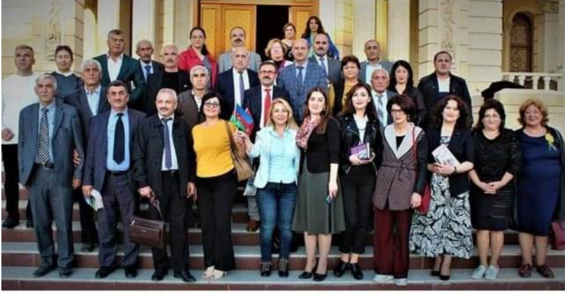
Türkiyədən gələn nümayəndə heyəti ilə şairlərin və fəallərin görüşündən xatirə