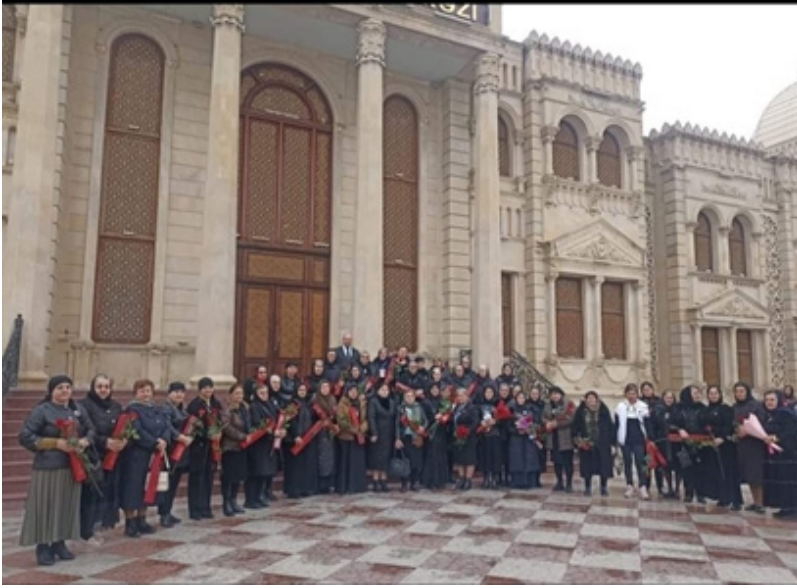
Heydər Əliyev muzeyində, şəhid ailələri və aktiv qadınlarla 8 mart qadınlar bayramındakı tədbirdəki görüşdən xatirə şəkili