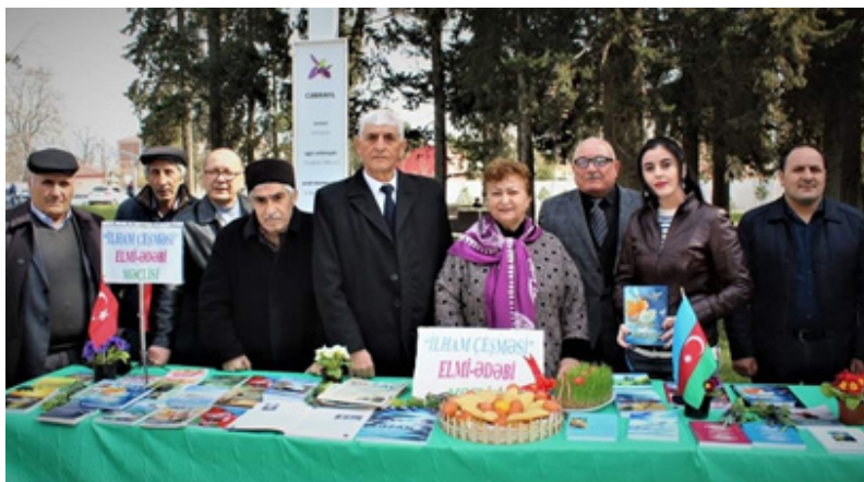
Novruz şənliyində «İlham Çəsməsi» elmi-ədəbi məclis üzvlərinin kitablarının nümayişi.